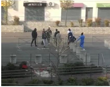
Chanteloup-les-Vignes (78), samedi dernier

DONC, ON CONTINUE A MARTELER : #JeResteChezMoi