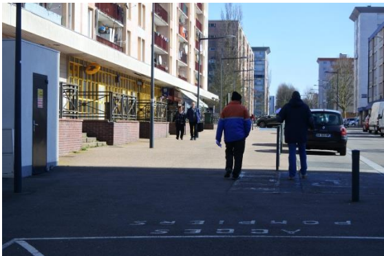
Une des artères principales du quartier de La Madeleine à Evreux, mardi 24 mars à midi.

Évreux, mardi 24 mars, 8e jour de confinement. Il est 12 heures, soit pile une semaine que les mesures de confinement sont entrées en vigueur, sur les quartiers politique de la ville de la préfecture de l'Eure, comme partout sur l'ensemble de la ville et du territoire national. L'azur immaculé du ciel éclaire l'ensemble de la cité ce mardi. Le soleil inonde les artères de la ville et du quartier de La Madeleine . La tentation de sortir est grande. De mettre le nez dehors, et ce en dépit des règles de confinement qu'une lutte efficace contre la propagation du coronavirus impose.