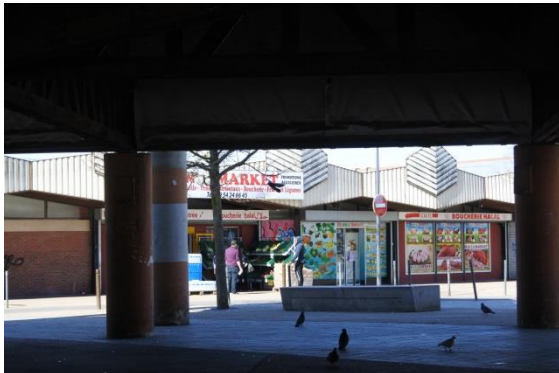
Le gérant d'une des épicerie – boucheries de La Madeleine accueille ses clients à l'entrée et filtre l'accès à la boutique, mardi 24 mars à midi.

les séparent. Ils discutent, palabrent un long moment. Mais seul le soleil est radieux, car les visages trahissent de plusieurs rictus l'angoisse qui caractérise cette période exceptionnelle.