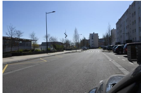
Une rue déserte à Nétreville, comme toutes les autres du quartier, mardi 24 mars peu après midi.

en plus contraignantes de confinement. Du moins en plein jour.